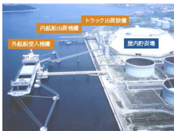
図2. コールセンター

一方、表1に示す11ヵ所がバルクターミナルで、コールセンターとも呼ばれています。コールセンターからは、内航船と鉄道およびトラックで、周辺の製紙工場、化学工場、繊維工場などに配送されています。コールセンターの主要な設備は、港湾設備、石炭搬入設備、貯炭設備、石炭払出設備です。港湾設備には図2に示すように、外航船受入棧橋と内航船出荷棧橋があり、20万トンクラスの外航船が接岸できるように16mから20mの水深が確保されています。石炭の陸揚げには、バース上に設置するアンローダー設備が使われます。いくつかの方式がありますが、大型のクレーンにバケットを吊るし、船倉から掴み上げる方式が主流です。アンローダーで陸揚げした石炭は、ベルトコンベアで貯炭場に運ばれて出荷を待ちます。入荷した石炭の在庫期間は、約1.5ヵ月から2ヵ月です。貯炭場には屋内型と屋外型があります。屋外型の主な安全対策としては、水を散布する発塵防止設備が備えられています。環境対策には排水処理設備が備えられています。表2に示すのが、